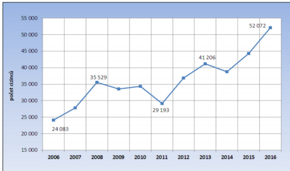
Vývoj počtu cizinců na trhu práce v JMK

Cizinci-držitelé živnostenského oprávnění představovali 16 % ze všech ekonomicky aktivních cizinců. Zatímco počet podnikatelů v uplynulých několika letech stagnuje, stav zaměstnaných cizinců setrvale roste. Mezi zaměstnanými cizinci pak tvoří téměř ¾ občané EU/EHP a Švýcarska s volným přístupem na trh práce (zde zaznamenáváme podstatný nárůst oproti předchozím letům), dalších 18 % pak třetizemci nepotřebující pracovní povolení (zejm. držitelé dlouhodobých pobytů). Méně než 8 % z celkového počtu zaměstnanců dnes připadá na cizince, kteří potřebují pracovní povolení. Z této skutečnosti také vyplývá omezená možnost Úřadu práce podstatným způsobem regulovat účast cizinců na pracovním trhu.